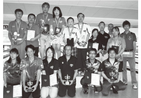
四国選手権大会入賞者