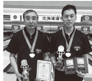
優勝チーム/札幌市役所