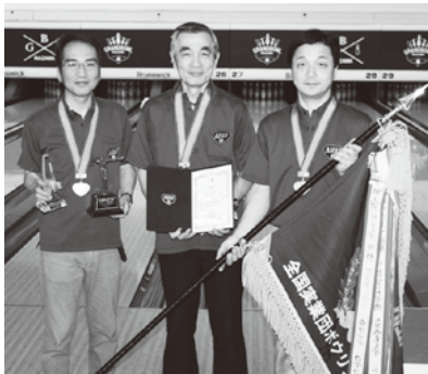
優勝チーム／警視庁(A)

〒144-0052 東京都大田区蒲田5-33-4 川名ビル2F TEL 03-3733-5888番 FAX 03-3733-5893番