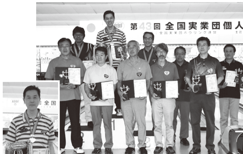
男子シニア入賞者