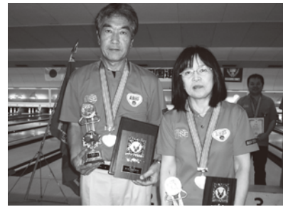
優勝チーム/荒川技建(A)