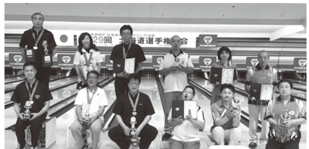
北海道選手権大会入賞者