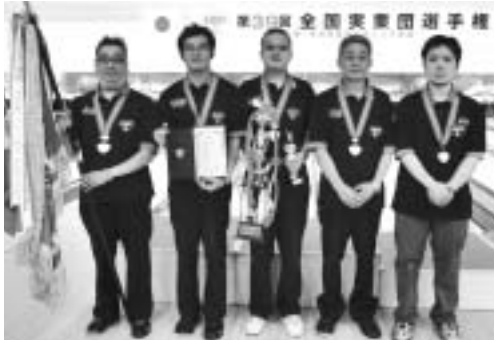
優勝チーム/鈴野製作所