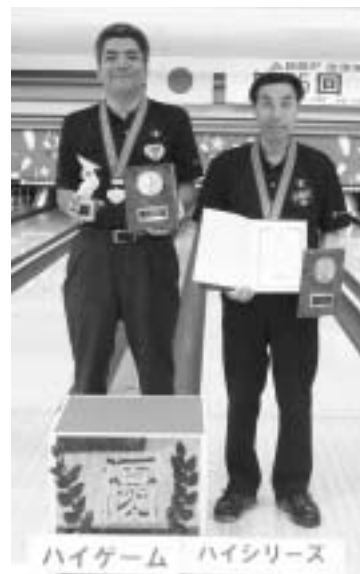
優勝チーム／ヤハラ消防設備