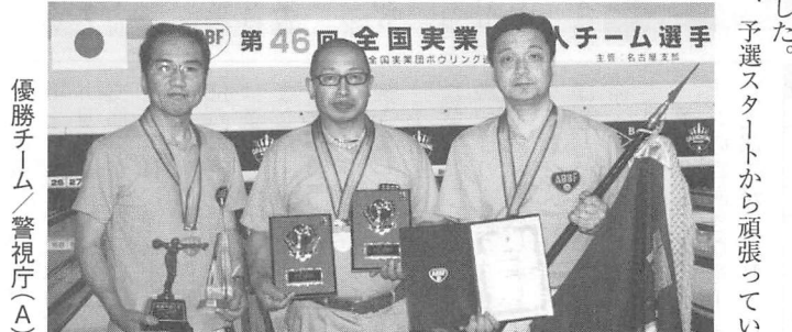
優勝チーム/警視庁(A)

入賞チーム 7月6日～7日に愛知県 稲沢グラン ドボウルで行われた「第46回全国実業団 3人チーム選手権大会」は161チーム (483名)が参加して行われました。 予選スタートから、チームシリーズ2、0