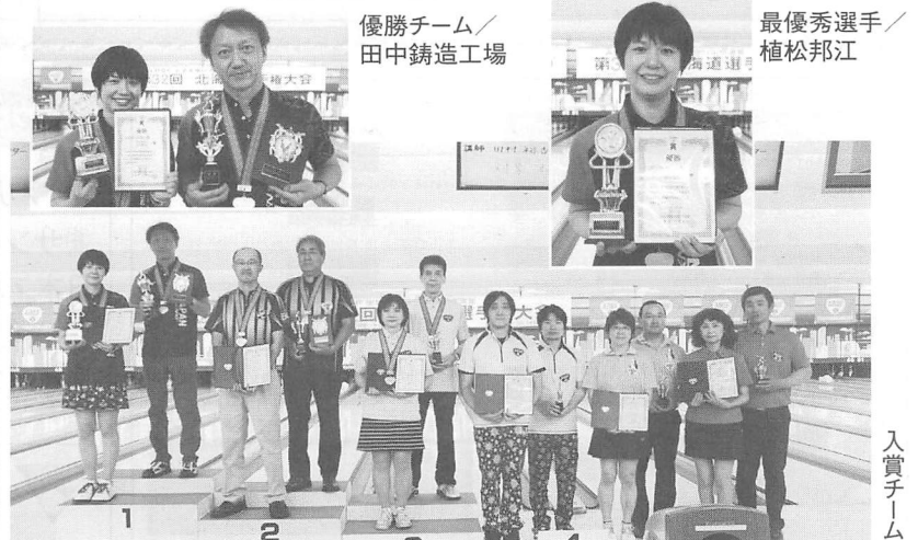
優勝チーム/田中鋳造工場